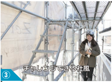
③ 手やレコでできる社風