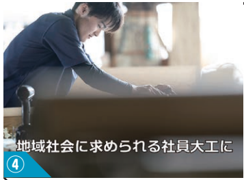
④ 地域社会に求められる社員大工に