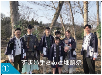
① すまい手さんと地鎮祭