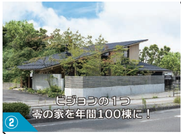
② ビジョンの1つ 零の家を年間100棟に！